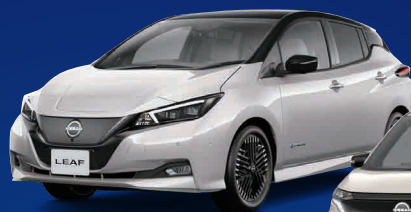
100%電気自動車 LEAF 日産リーフ