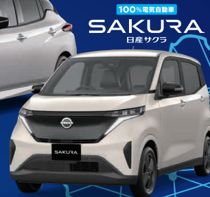
100%電気自動車 SAKURA 日産サクラ